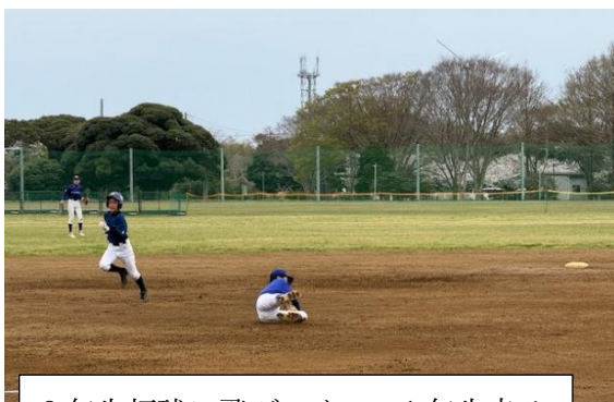
2年生打球に飛びつく 1年生走る