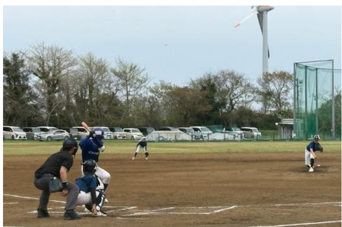
1年生投げる 2年生打つ