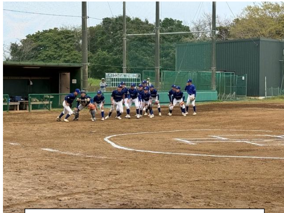
いよいよ試合にベンチ前 1期生