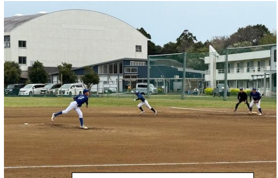
2年生投げる 1年生走る